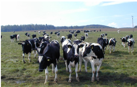
Kühe auf der Weide