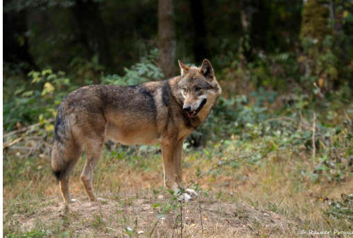
Titel: Grauwolf

Die Rückkehr des Wolfes nach Deutschland ist ein naturschutzfachlicher Erfolg. Seit dem Jahr 2000 leben Wölfe wieder dauerhaft in Deutschland, seit dem Frühjahr 2020 auch in Hessen. Seine enorme Anpassungsfähigkeit hilft ihm bei der Wiederbesiedlung einstiger Lebensräume.