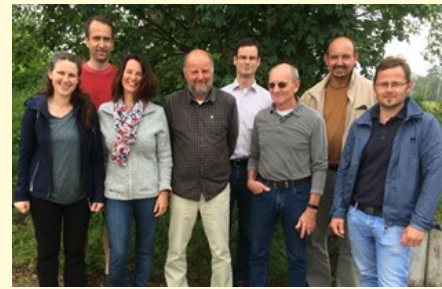
Bild 1: OG Biogemüse GbR