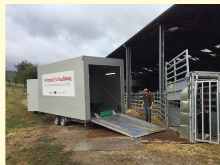
Bild 1: Kurz vor der Schlachtung: der Schlachtanhänger mit Rampe ist ausgeklappt und steht bei der Fixiereinrichtung.