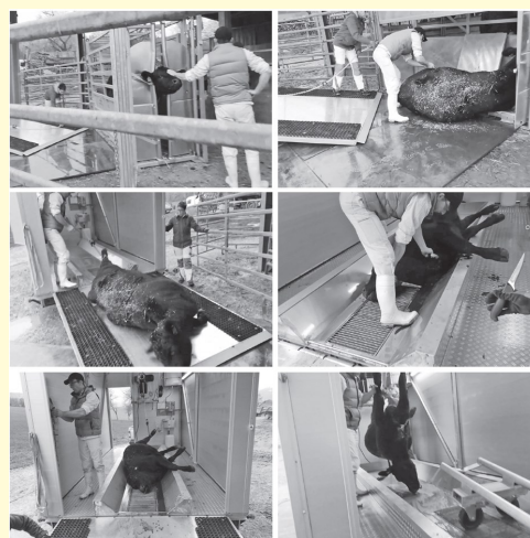
Bild 2: Schlachtfolge: Fixieren – Betäuben – Anhängen und Verbringen in die Schlachtfolge mit der mobilen Schlachteinheit – Töten durch Blutentzug – Anlieferung bei stationärem Schlachtbetrieb – das Rind wird angehoben, um den Schragen darunter zu führen.